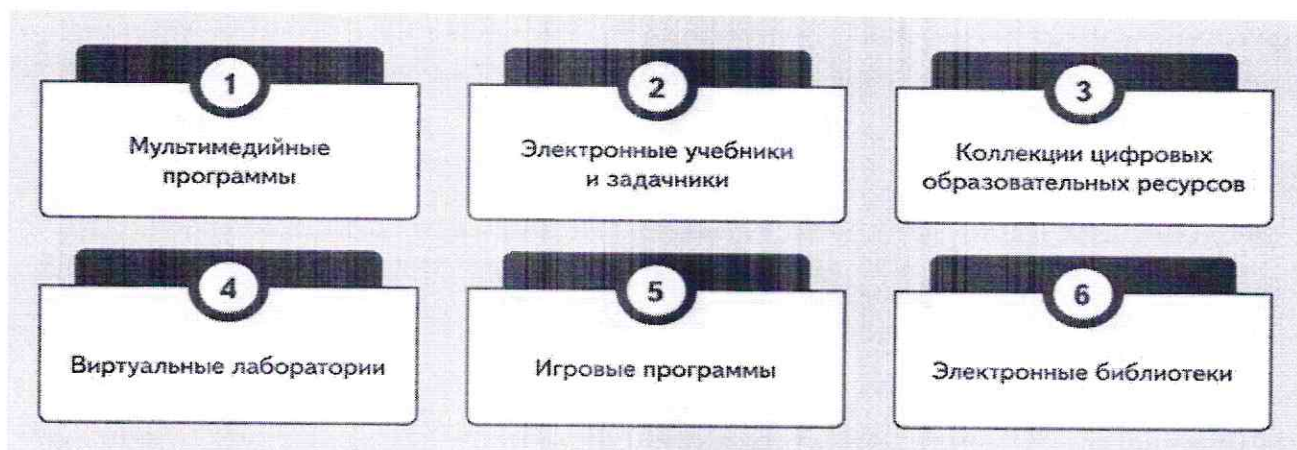
Схема 5. Электронные учебно-методические материалы, которые можно включить в тематическое планирование

Включите календарно-тематическое планирование в структуру рабочей программы только в том случае, если такое требование устанавливает локальный акт школы о программах. Календарно-тематическое планирование учебного предмета, курса, модуля или курса внеурочной деятельности составьте на основе тематического планирования.