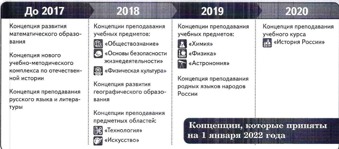
Схема 2. Концепции преподавания учебных предметов и предметных областей

Концепции, которые приняты на 1 января 2022 года