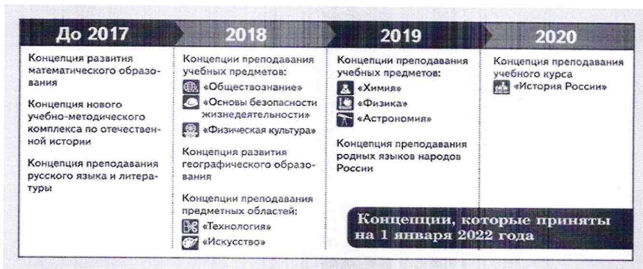
Схема 2. Концепции преподавания учебных предметов и предметных областей

Если вы составляете рабочую программу курса внеурочной деятельности, обязательно отметьте в ней формы проведения занятий с детьми (п. 31.1 ФГОС-2021 НОО, п. 32.1 ФГОС-2021 ООО). Это единственное дополнение к общей структуре рабочих программ, которое добавили в стандарты третьего поколения.